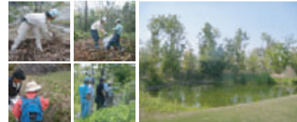
草地移植 生物のモニタリング調査